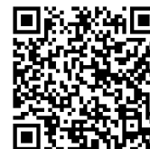
FORMULARIO PRINCIPAL DS-11

El formulario principal de solicitud de pasaporte se llama DS-11, y se utiliza para todos los menores de 16 años. Tiene que presentarse en persona en un lugar de trámites de pasaportes, como una oficina del servicio postal u otro sitio autorizado. Ambos progenitores deben estar presentes para presentar la solicitud. Si los padres no pueden presentarse, puede hacerlo un tutor legal. Este formulario no necesita notarización ni testigos, pero todos los implicados deben ir en persona.