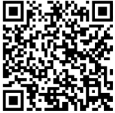
د DS-11 اصلي فورمه

د پاسپورټ غوښتنلیک اصلي فورمه DS-11 نومېږي، او دا د ټولو هغو ماشومانو لپاره کارول کېږي چې عمر یې له 16 کلونو څخه کم وي. دا فورمه باید په حضورې توګه د پاسپورټ د منلو په کوم ځای (لکه پوسته‌خانه یا بل تصویب شوي مرکز) کې وسپارل شي. د غوښتنلیک پر مهال باید دواړه والدين حاضر وي. که دواړه حاضر نه شي، یو قانوني سرپرست هم کولای شي دا کار ترسره کړي. د دې فورمې لپاره نه د اسنادو د دفتر تصدیق ته اړتیا شته او نه د شاهدانو؛ خو ټول اړوند کسان باید په حضورې ډول حاضر وي.