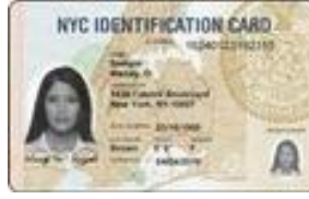
هوية مدينة نيويورك